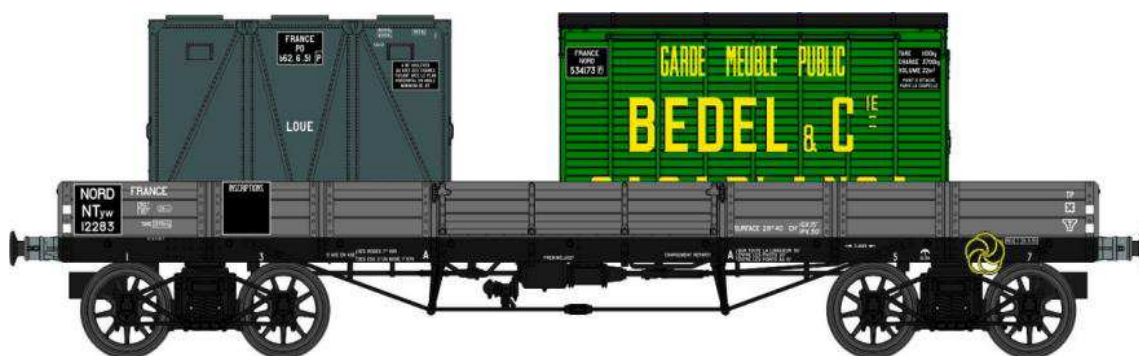
Réf. WB-421 - Wagon PLAT TP à 6 ridelles Ep.II NORD

W028-A-03 Wagon freiné, 4 roues à rayons NTyw 39103 + 3 Cadres SNCF (1938-1946)