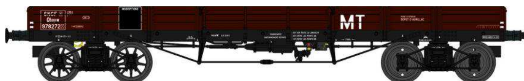
Réf. WB-425 - Wagon PLAT TP à 6 ridelles Ep.III SNCF MT

W028-C-02 Wagon freiné, 3 roues pleines et 1 roue à rayons JQhoy 7137164 + 3 Cadres SNCF