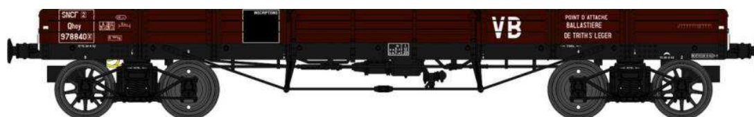
Réf. WB-428 - Wagon PLAT TP à 6 ridelles Ep.III SNCF VB

W028-E-03 Wagon freiné, 2 roues pleines et 2 roues à rayons Qhoyw 172233 + 2 Cadres SNCF