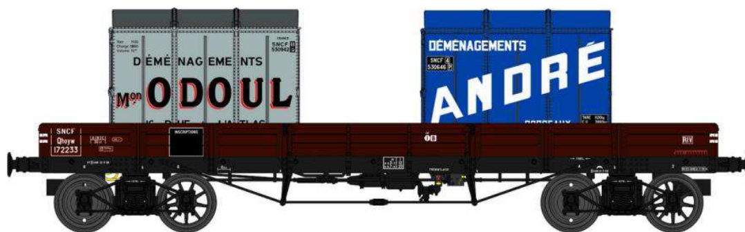
Réf. WB-427 - Wagon PLAT TP à 6 ridelles Ep.III SNCF

W028-E-03 Wagon freiné, 2 roues pleines et 2 roues à rayons Qhoyw 172233 + 2 Cadres SNCF