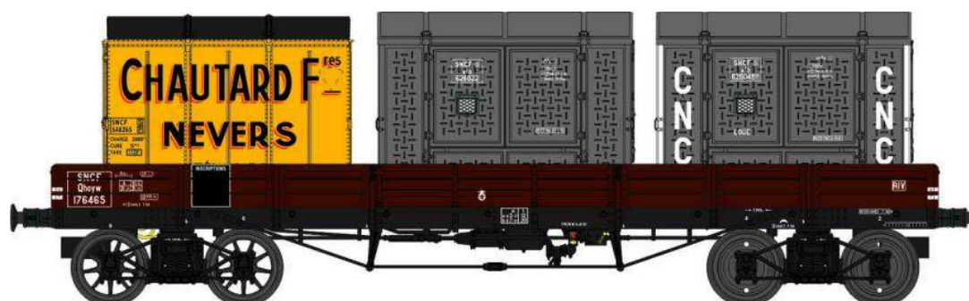
Réf. WB-426 - Wagon PLAT TP à 6 ridelles Ep.III SNCF

W028-D-03 Wagon freiné, 2 roues pleines et 2 roues à rayons Qhoyw 978272 Nouveau Numéro