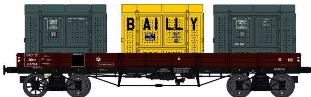
Réf. WB-424 - Wagon PLAT TP à 6 ridelles Ep.III SNCF

W028-B-04 Wagon freiné, 4 roues pleines NTyw 96312 + 2 Cadres Anciens Réseaux