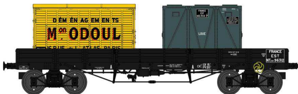
Réf. WB-423 - Wagon PLAT TP à 6 ridelles Ep.II EST

W028-B-04 Wagon freiné, 4 roues pleines NTyw 96312 + 2 Cadres Anciens Réseaux