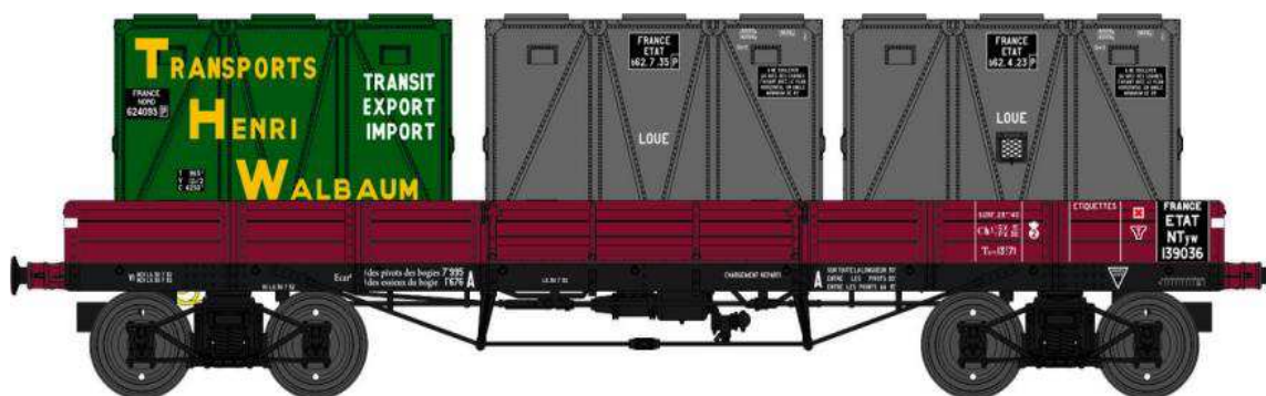
Réf. WB-422 - Wagon PLAT TP à 6 ridelles Ep.II ETAT

W028-A-04 Wagon freiné, 4 roues à rayons NTyw 12283 + 2 Cadres Anciens Réseaux